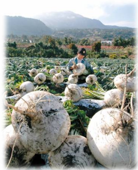
桜島の麓に広がる大根畑での収穫風景