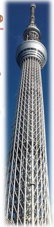
東京スカイツリーに“桜島大根”がやってくる