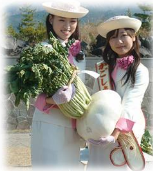
昨年の「世界一桜島大根コンテスト」の優勝大根は、重さ16.5kg 胴回り100.0cm

味のしみ込みが良く、甘みがあり、柔らかいのに煮くずれしにくいといった特徴があり、フリ大根・おでん・漬物等によく用いられます。