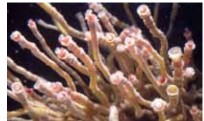
サツマハオリムシ

錦江湾の豊かさと火山が育む不思議な生きもの「サツマハオリムシ」。いつもの会場から大きく飛び出し、ハンズオン展示を楽しめるキッズコーナーや記念イベント、オリジナルグッズの制作販売など、全館を挙げて錦江湾の大発見「サツマハオリムシ」の生き方に迫ります。ぜひ水族館へ足を運んで、サツマハオリムシの魅力を感じてください。