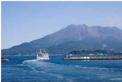
桜島フェリーと桜島

雄大な活火山桜島を背景に桜島と錦江湾の新たな魅力を体感していただくため、錦江湾の湾奥を巡るクルーズ船を運航します。航海中には、火山の専門家や水族館職員による船上講演会やお楽しみ抽選会等が実施され、桜島と錦江湾の魅力を、約2時間20分のクルージングを通してお楽しみいただけます。皆様のご乗船をお待ちしております！