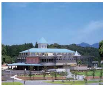
スパランド裸・楽・良