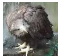
オジロワシ (不思議な動物ゾーン)

ここでは、南アメリカの森林地帯に生息する動物たちを展示します。動物と同じ目線となるガラスビューや、動物を下から観察することもできる空中ケージを設置するなど、これまでとは違う展示方法を取り入れ、動物たちの動きを間近で観察できるようになります。