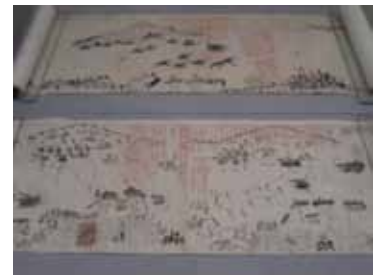
薩英戦争絵巻 (鹿児島市維新ふるさと館所蔵)