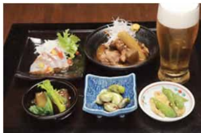
<美味セットの一例>