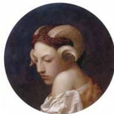
ジャン＝レオン・ジェローム 《羊の角をつけた女性の頭部》

フランス西部にあるナント美術館は1801年に創設されました。古い歴史と伝統を持つ同館のコレクションより、19～20世紀に活躍した画家の選りすぐりの作品を紹介します。アカデミズムから始まり新古典主義、ロマン派、オリエンタリズム、バルビゾン派、印象派、フォーヴィスム、キュビスムへ至る様式変遷とモネ、ルノワール、ピカソなど近代美術史を彩る画家の作品群をお楽しみください。