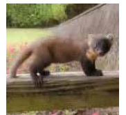
ホンドテン (かごしまの動物ゾーン)