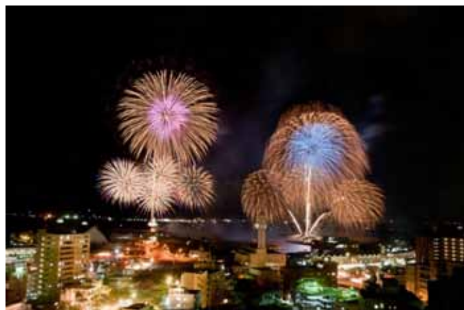
第12回かごしま錦江湾サマーナイト大花火大会の様子

※かごしま錦江湾サマーナイト大花火大会公式サイト ( http://hanabi.kankou-kagoshima.jp/ ) で、過去の大会のハイライト動画や写真がご覧いただけます。