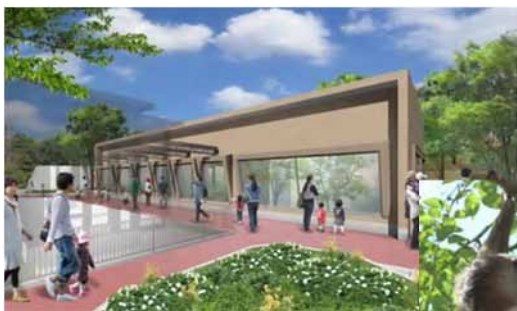
南アメリカの自然(森)ゾーン