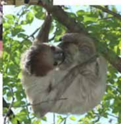
フタユビナマケモノ