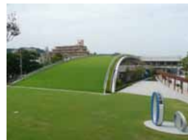
かごしま環境未来館