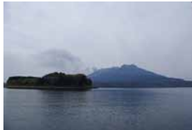
新島付近から昭和火口を望む